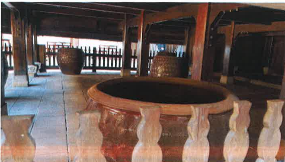
舞台下方放有多個水缸，形成天然音箱