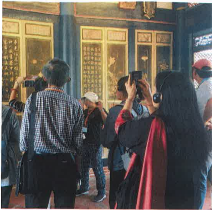
文史工作者講解這些字畫的來由與歷史典故