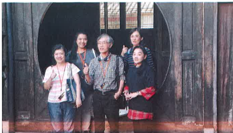
大花廳旁圓形門的合照