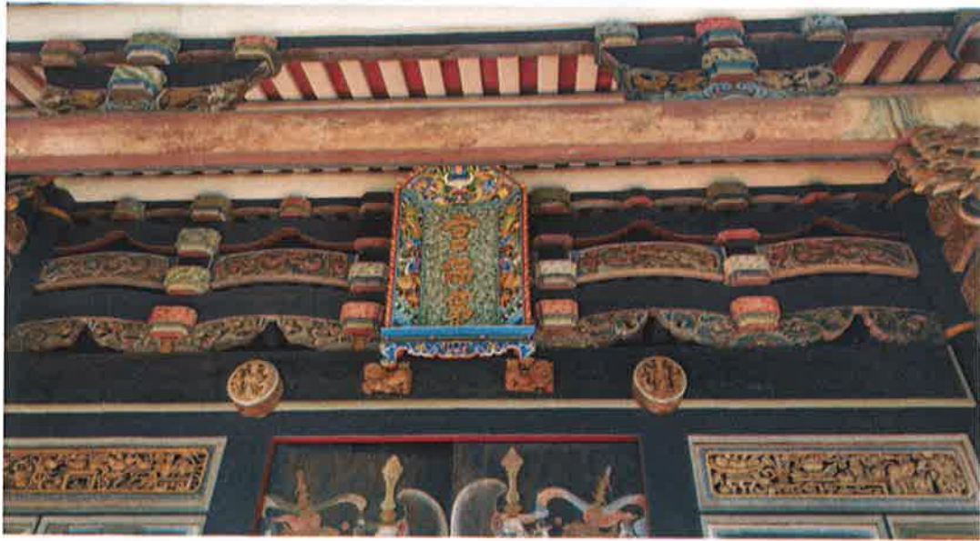
宮保第正門上方匾額是做工精細的複製品，真品因為太珍貴被收起來了