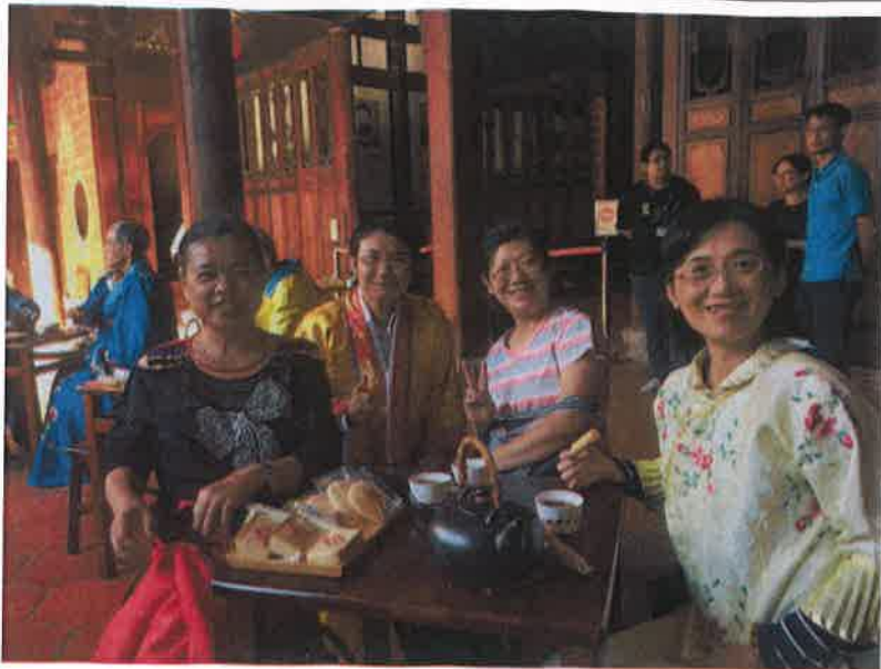
穿著古裝聽樂品茶