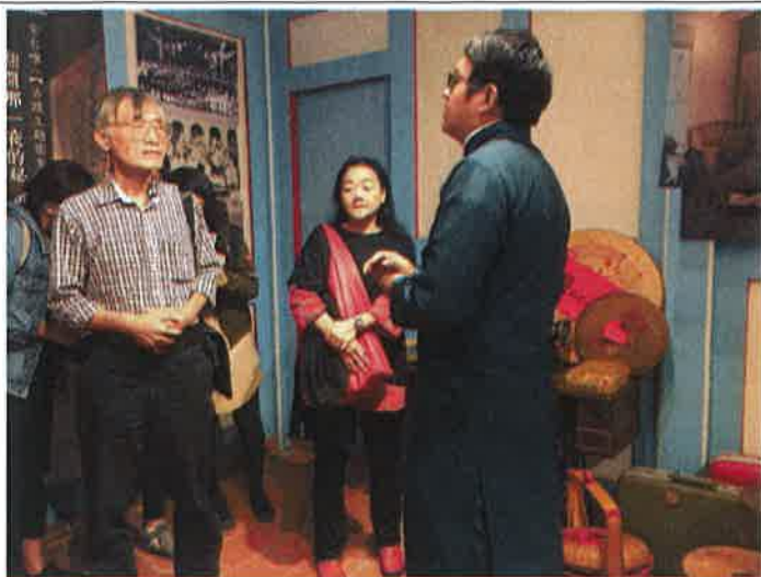
在密室逃脫前管家解說故事背景及破關方法