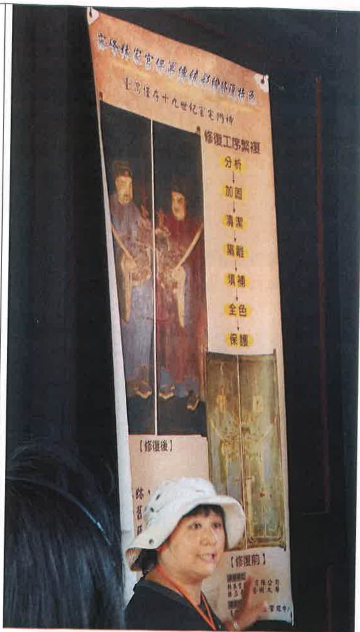
導覽文史工作者，細心講解修復工程步驟以及修復一件作品要花多久時間