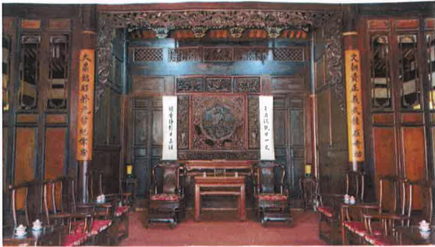
古代商討大事場所(在舞台的正前方)商討完就直接看戲