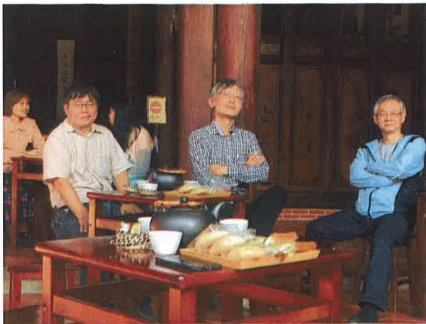
老師們正在觀賞古樂的演奏