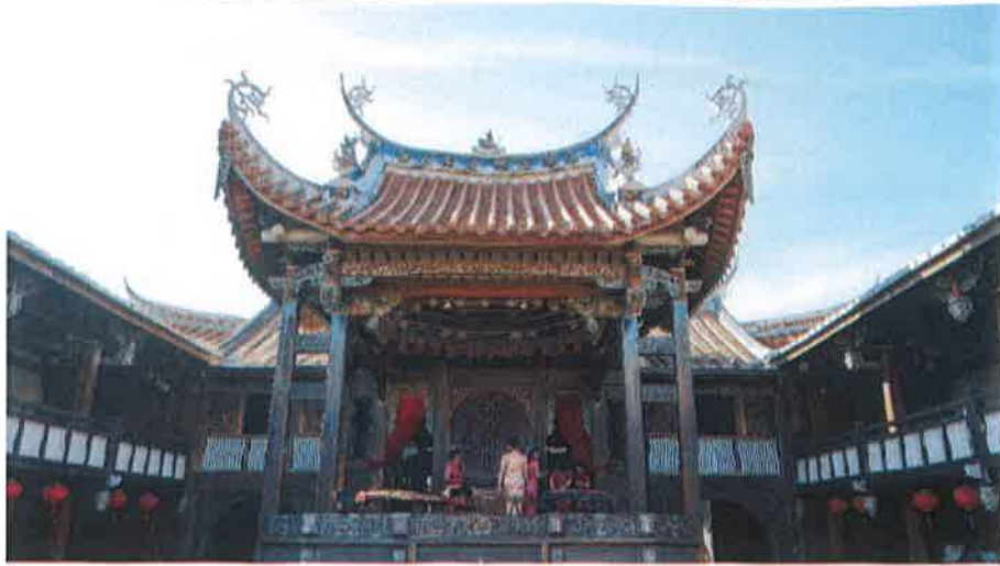
大花廳，古代表演京劇的舞台，今日特為我們準備了古箏的表演