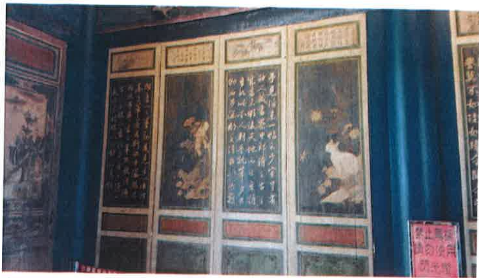
古代文人的字畫，每幅畫都有吉利正向的意義